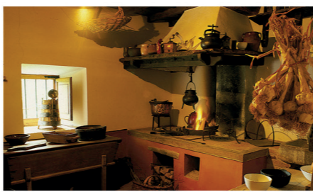
Museo Etnográfico del Oriente de Asturias