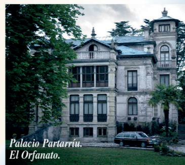
Palacio Partarrui. Orfanato.