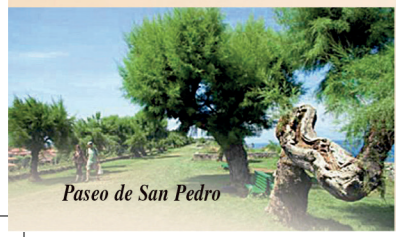
Paseo de San Pedro